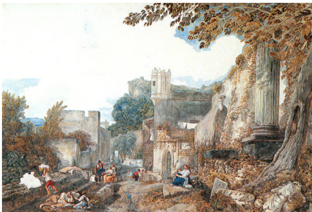
Figura 5. Abraham-Louis-Rodolphe Ducros, il Tempio della Fortuna a Marechiaro.

La ricchezza degli Orti di Napoli si riversa necessariamente in città. I diari – pur non cogliendo la forte presenza di di brani di campagna inclusi nel tessuto urbano – pullulano di annotazioni dense di meraviglia per l'abbondanza delle merci e dei prodotti della terra. Si legga, una fra tante, la testimonianza di Pâris: «Il pane è eccellente a Napoli. La carne mi è parsa egualmente buona. Quanto alla frutta e alle verdure, sono di una abbondanza straordinaria. Tra la frutta, oltre a quella che noi coltiviamo, hanno la giuggiola e la sorba, che non conosciamo. La giuggiola ha una polpa secca, secondo me poco gradevole alla vista (somiglia a una grossa ghianda) e al gusto. La sorba somiglia a una pera della grandezza della grossa pera ruggine. È straordinariamente dorata su un lato; ma deve essere molle per essere mangiata, allora è un po' migliore di una nespola. Hanno anche la carruba, ma non ne ho mangiate. La melagrana è estremamente grossa, e chi l'apprezza la trova eccellente» 18 . La vendita dei prodotti orticoli porta così in ambito urbano il riflesso di un contado incredibilmente generoso. I viaggiatori apprezzano, anche visivamente, la presentazione e lo scambio di merci: tutto avviene con un rumore che stupisce per intensità e costanza.