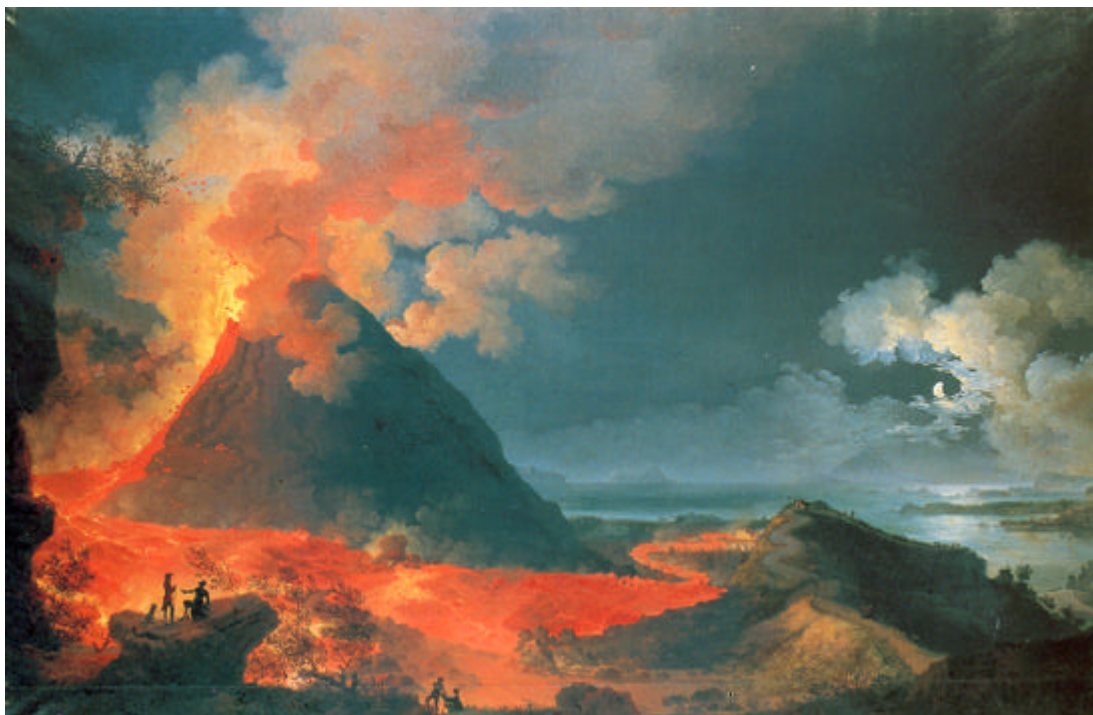
Figura 8. Pierre-Jacques Volaire, a Napoli negli anni Settanta del XVIII secolo, è noto ai suoi contemporanei per le rappresentazioni del Vesuvio.