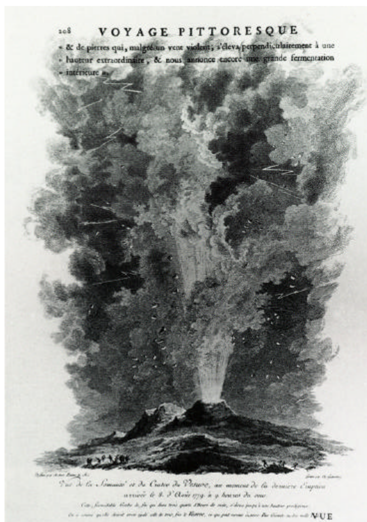
Figura 10. L'eruzione del Vesuvio del 1779 in una pagina dell'opera monumentale dell'abbé de Saint-Non.

paesaggio che i voyageurs settecenteschi si aspettano dalle campagne napoletane: un territorio bien peuplé , in un pittoresco quadro naturale, dove un'attenta sistemazione della natura sia «abbellita dagli sforzi dell'arte».