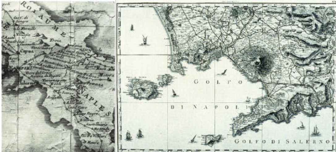
Fig. 1. Le Routes des Postes d'Italie , in una carta francese del primo Settecento (particolare).