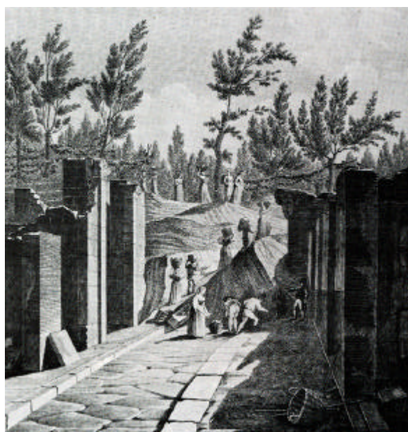
Figura 9. Gli scavi di Pompei in un'incisione di Mazois dei primi anni del XIX secolo. I resti della città antica vennero alla luce in un paesaggio agrario dove era prevalente la coltura della vite maritata al pioppo, rappresentata con verità sullo sfondo dell'immagine. Si notino, sulla sinistra, i festoni di vite a palchi.